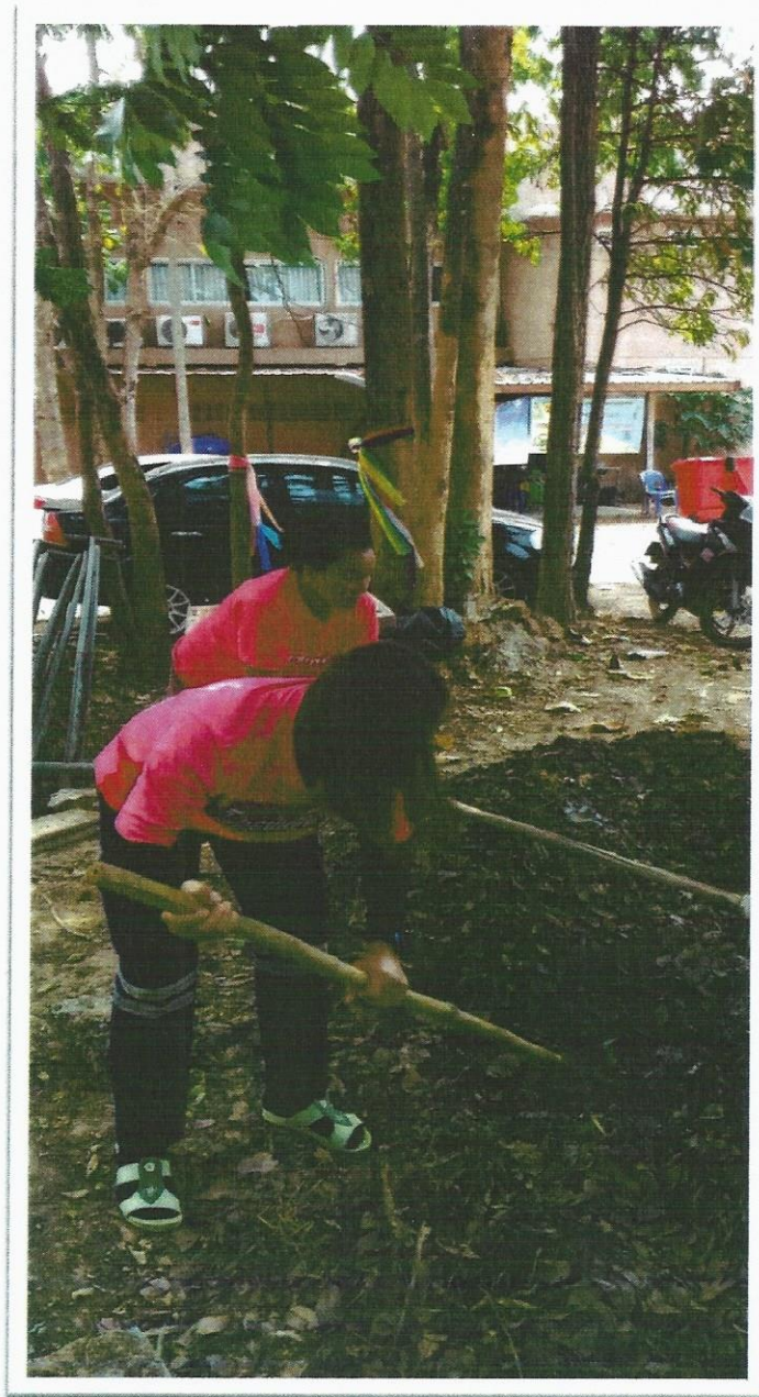
- กลับด้านปุ๋ยหมัก