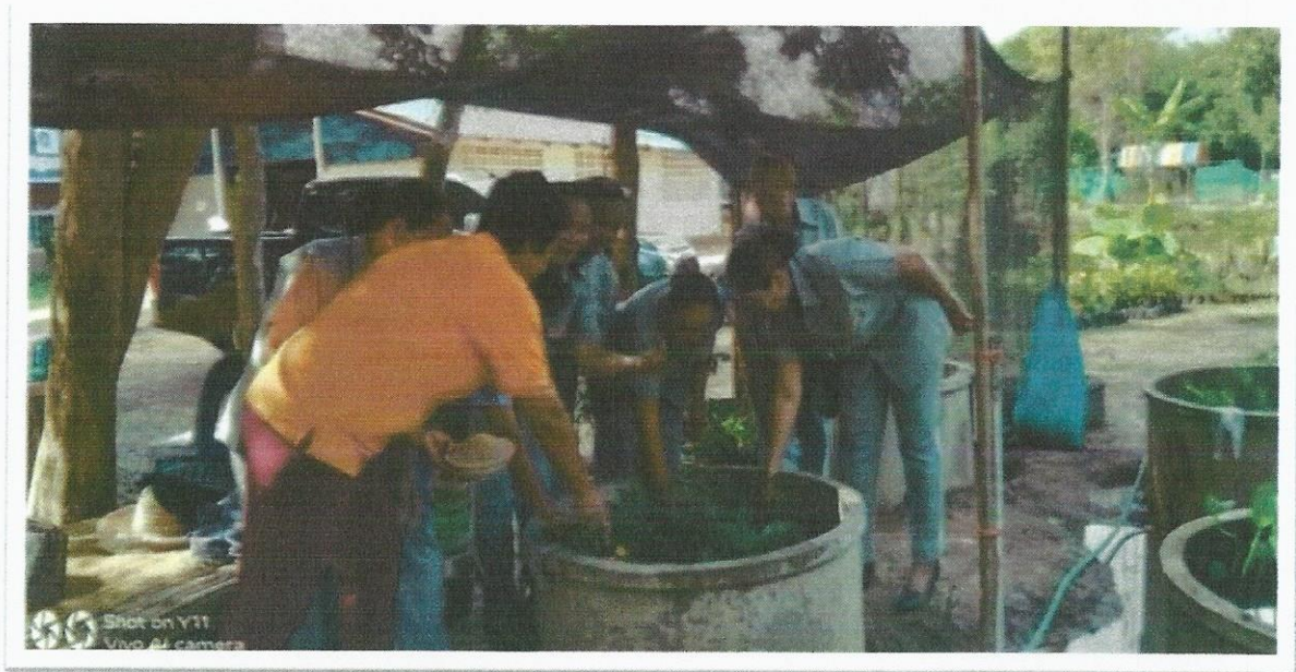
- ผลผลิตทางการเกษตร